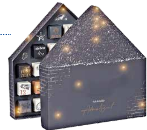
Gefalteter Kartonrahmen mit Faltschachteln