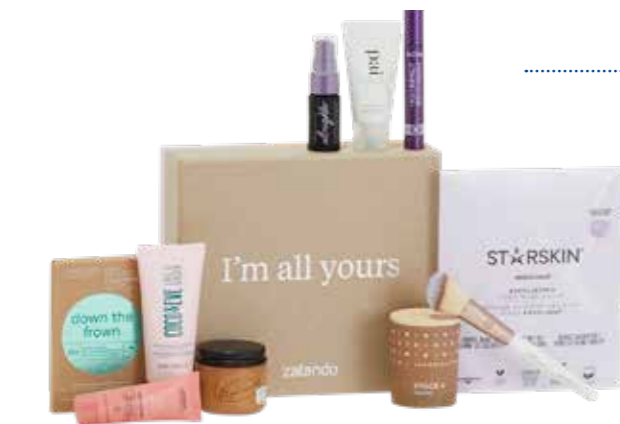
Hartkartonagenbox mit Deckel