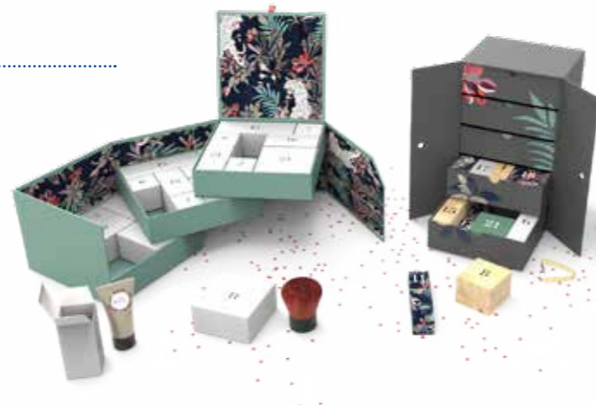
Hartkartonagenbox mit Faltschachteln oder Hartkartonagenschubladen. Optional mit Türen oder Klappe