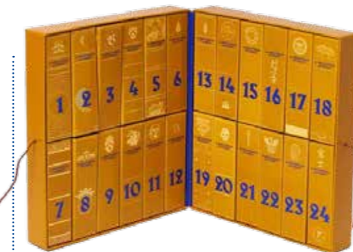
Hartkartonagenbox mit Faltschachteln. Verschließbar mit Band/Schleife/Schnur