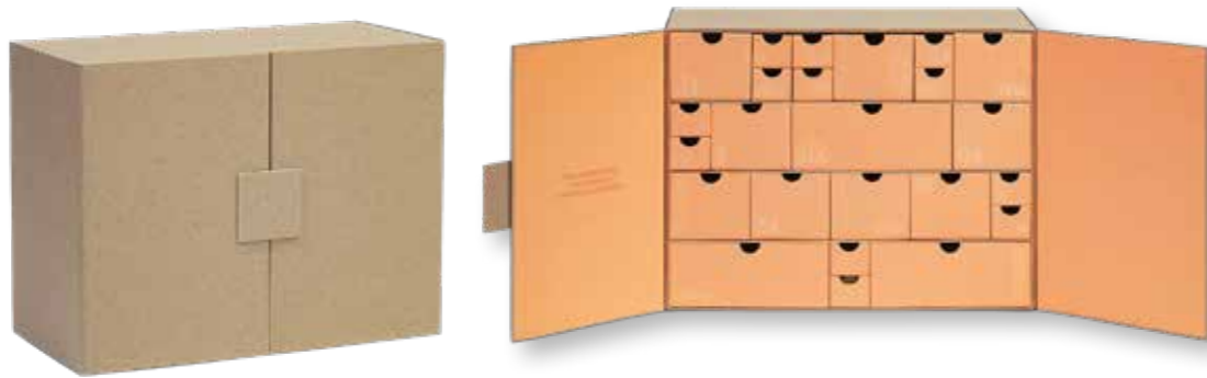
Hartkartonagebox mit Hartkartonagenschubladen. Türen mit Magnet verschlossen