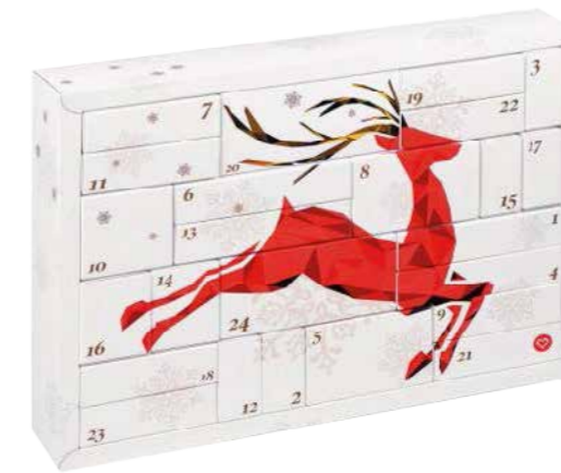
Hohlraumkalender mit Faltschachteln