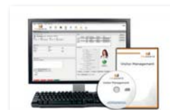
Upgrade von Basic auf Advanced