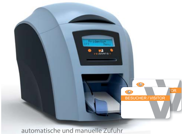
automatische und manuelle Zufuhr

vorgedruckte Plastikkarten alternativ auf Anfrage