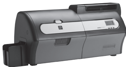
Zebra ZXP Series 7