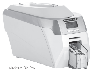
Magicard Rio Pro