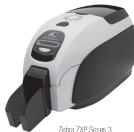
Zebra ZXP Series 3